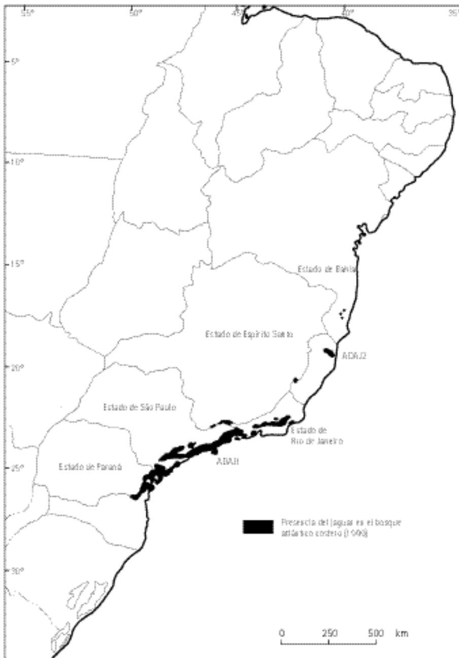
Figura 2. Presencia de jaguares en áreas protegidas del bosque atlántico costero de Brasil, 1999.